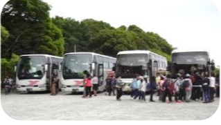
(野外会場実施イメージ)

※料金は、1日・半日かわかわらず、「1日料金」が発生します。 ※4-6月はあしがら会場の繁忙シーズンとなるため、出張型は対応できかねる場合がございます。 ※半日実施時、9:30より前の開始、及び15:30より後の終了は対応出来かねます。