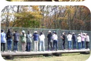
(学校実施イメージ)