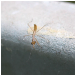
ムネアカハラビロカマキリ

雨の日が多くなり、アジサイが色鮮やかに咲いています。先日梅雨入りのニュースも発表され、ジメジメした日が多くなりました。◆クリが早くも実っていました。まだ雌花の名残が先端に白く残り、小さな冠のようで可愛らしいです。梅雨時期を表す言葉で「栗花落（つゆり）」がありますが、栗の花が落ちる時期が梅雨入りの季節であるため「栗花落」の字に充てられたそうです。◆薄暗い林の中にギンリョウソウが咲いていました。ユウレイタケ（幽霊茸）の別名があり薄暗い林の中に半透明の姿が神秘的に見えました。◆ヒバカリが外の水槽の中に頭を入れ、オタマジャクシを捕食していました。無毒ですが、かつては毒へびと考えられおり「噛まれたら命がその日ばかり」が名前の由来とされています。実際はとても大人しく遭遇しても襲ってくるような生き物ではありません。◆ネムノキがピンク色の綿毛のような花を一斉に咲かせ始めました。夜になると葉が合わさって閉じ、垂れ下がる就眠運動をすることからこの名がつけました。ネムノキは「合歓木」と書き、葉が合うところから中国では夫婦円満の象徴とされています。