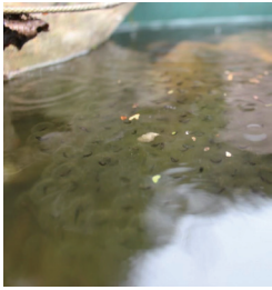
ヤマアカガエルの卵