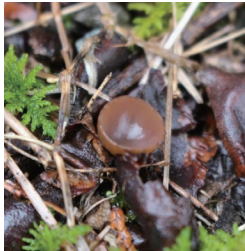
ツバキキンカクチャワンタケ