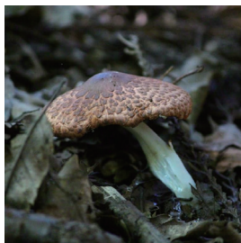
ザラエノハラタケ