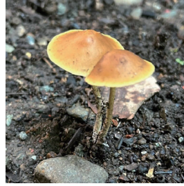
ヤケアトツムタケ

キノコの季節がやって来ました。今年はどうなキノコが見られるか、期待しながらさがしてみました。◆柄が細長く、傘の表面にきめ細やかな模様があるツエタケがありました。漢字では「杖茸」と書き、長い柄が杖に似ていることからだそうです。柄は土のなかにも続き、長いものだと30cm程にもなるそうです。◆炭や灰を処理する場所にキノコが生えていました。生えている場所が名前の由来であろうヤケアトツムタケという名前のキノコです。焼け跡に生えるキノコは、他にも数種類あるようです。◆森の中に映える鮮やかな色彩のキノコはキツネノエフデというかわいらしい名前です。エフデは形から「絵筆」を表しているのでしょうか。キツネノエフデなどスッポンタケの仲間にはキツネノタイマツヤコイヌノエフデ、カニノツメなどといった生き物の名前が入ったユニークなものが多いです。実物を探してみたいくなります。