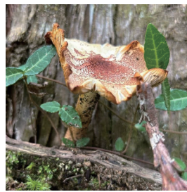
コムラサキモリノカサ