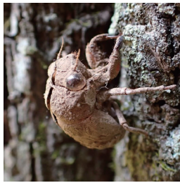
ニイニゼミ抜け殻