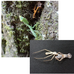
カマキリの幼体と抜け殻