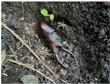
ノコギリクワガタ

暑いですね。今年の夏は例年よりも暑いなんて言われていますが、毎年もう無理というほど暑いので理解不能になります。◆ある日夕方の村内を歩いていると、クヌギの木にノコギリクワガタを見つけました。周辺を探すとオス五匹、メス一匹と大収穫でした。一気にこれほど獲れたのは初めてです。これも暑さの影響でしょうか。ノコギリクワガタは大顎の形が様々です。写真の個体の形は両歯型などと呼ばれます。◆枯れ木に張り付いてせっせとなかをかをしているハチがいました。ミカドジガバチです。ジガバチの仲間がガなどの幼虫に毒針を刺して神経を麻痺させ動けなくします。そしてその獲物を巣穴に運び、獲物に卵を産んで巣穴に蓋をします。写真撮影時はしばらく観察をしていると、巣穴に蓋をして飛び立っていきました。蓋をしたら親はもう戻らず、卵から孵化した幼虫は獲物を食べて成長します。珍しい場面に立ち会うことができました。