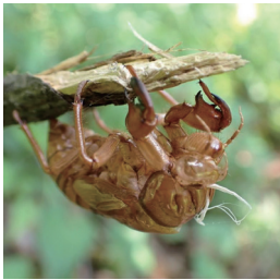
アブラゼミ抜け殻