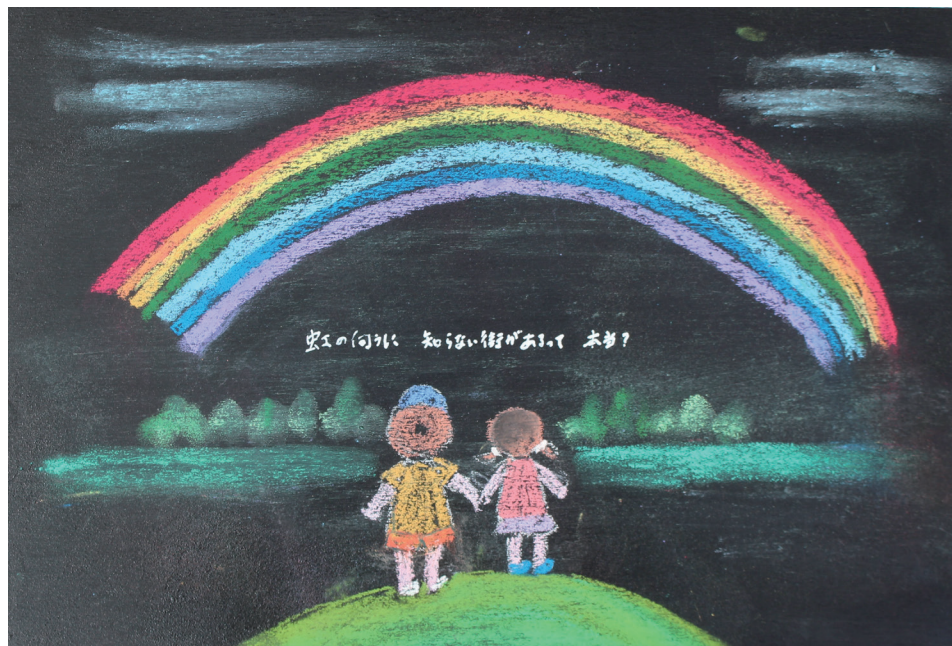
チョーク絵 川澄 暹

虹の向こうに知らない街があるって本当？ 二人で歩いてみたい 夢の街 きつと ボクの思い出に きつと ワタシの思い出に 消えることない 虹の街 七色は 二人を 染める 未来に 続く 雨の弓