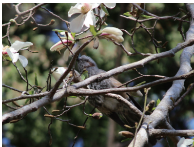
コブシの花の蜜を吸うヒヨドリ