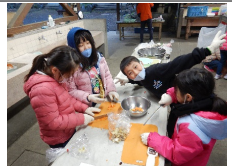
みんなでカレー作り♪