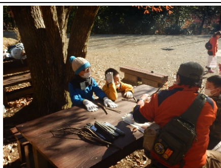
なにをつくらうか？