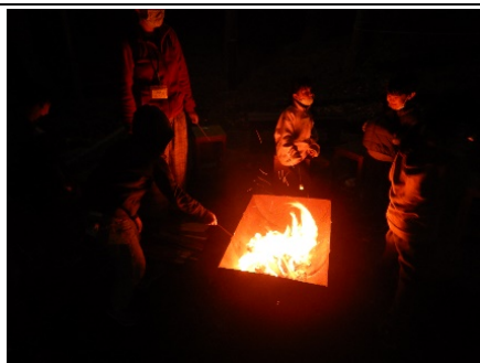
たき火、あったかい(;´▽`)