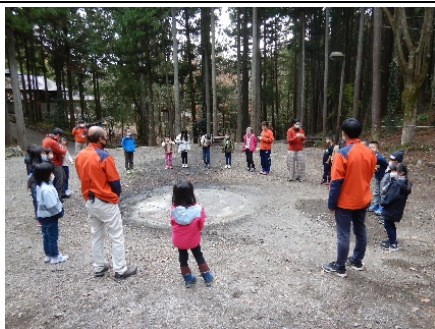
さあ、キャンプの始まりです！