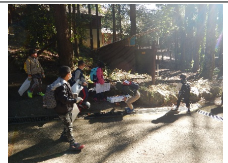
森の落とし物はどこだ？