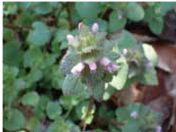
ヒメオドリコソウ