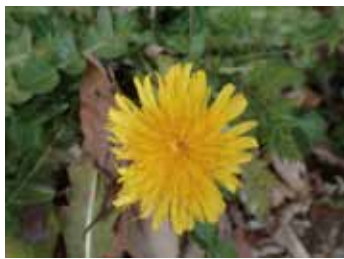
カントウタンポポ