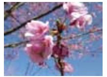
ダイユウベニザクラ

俳句で花といえば桜を意味するように、古くから日本人は桜を春の喜びとともに愛でてきました。 桜色に周囲が染まったと思ったら、あっという間にはらはらと散ってしまう潔さが桜にあります。南北に長い日本列島は、これからはしばらく桜を楽しめる季節となります。 日本各地に桜の名所も多いのですが、都会の片隅にも思わぬ名所を見つけることができます。自分だけの？密かな名所を見つけてみてはどうでしょうか。