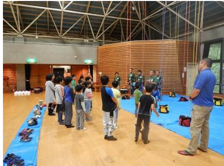
レクチャーを受けよう！！