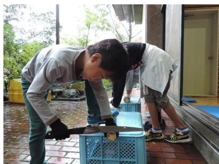
うまく切れるかな？