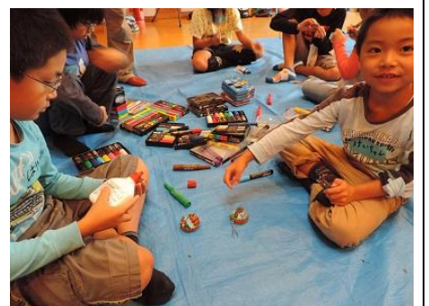
キーホルダーうまくできたよ。