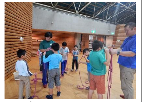
ロープの結び方も教えてもらいました。