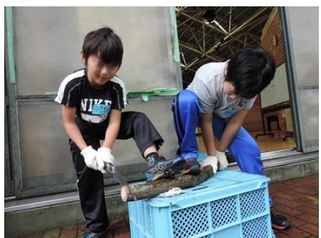
のこぎりぎこぎこ～