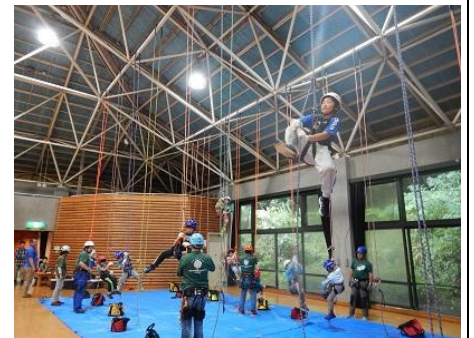
よっこらせ！！がんばれ～！