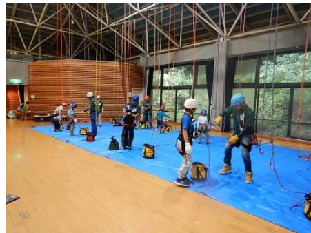
さあ、実際に練習だ！！